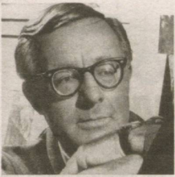
Рэй БРЭДБЕРИ (1920-2012) Америка ёзувчиси