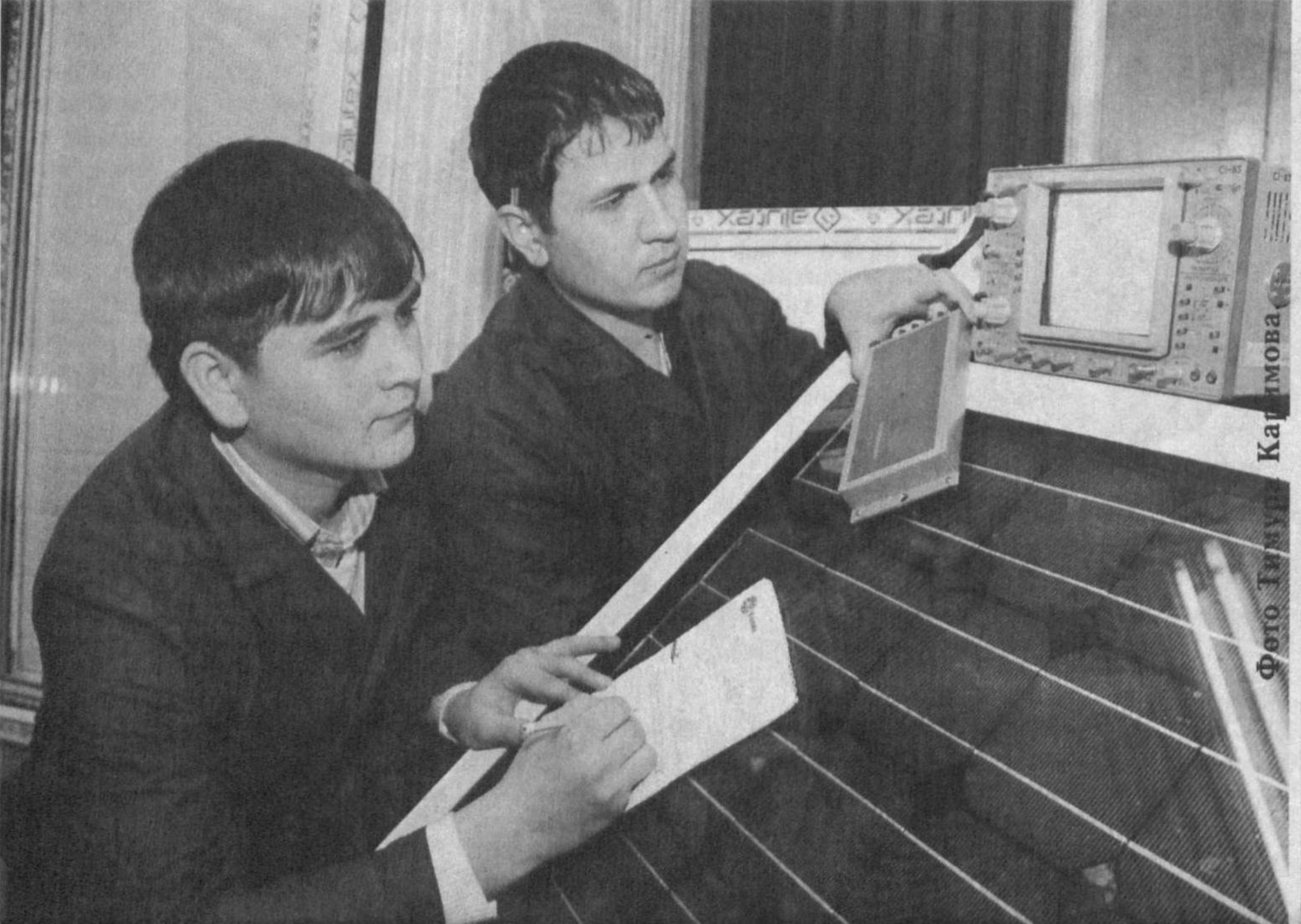
Благодаря географическому положению в нашей стране много солнечных дней в году. Поэтому в последнее время большим спросом пользуются комбинированные фотоэлектрические станции, которые выпускает ООО "Mir solar".

Они широко применяются в геологии, фермерских хозяйствах, природоохранных организациях. Ими оснастили и некоторые сельские врачебные пункты. В нынешнем году намечено произвести 400 комплектов комбинированных фотоэлектрических станций. По этому виду продукции предприятие в прошлом году было включено в Программу локализации. Ее уровень достиг 64 процентов.