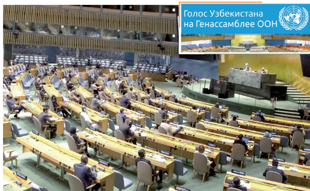
Голос Узбекистана на Генассамблее ООН

Выступление Президента Шавката Мирзиёева на 75-й сессии Генеральной Ассамблеи ООН продолжает находиться в фокусе внимания мировой общественности и экспертов.