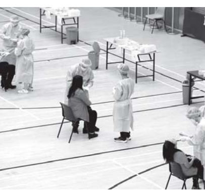
Процедура массового скрининга населения на COVID-19

В зоне особого внимания были районы с высоким уровнем риска. Здесь упор делался на предотвра-