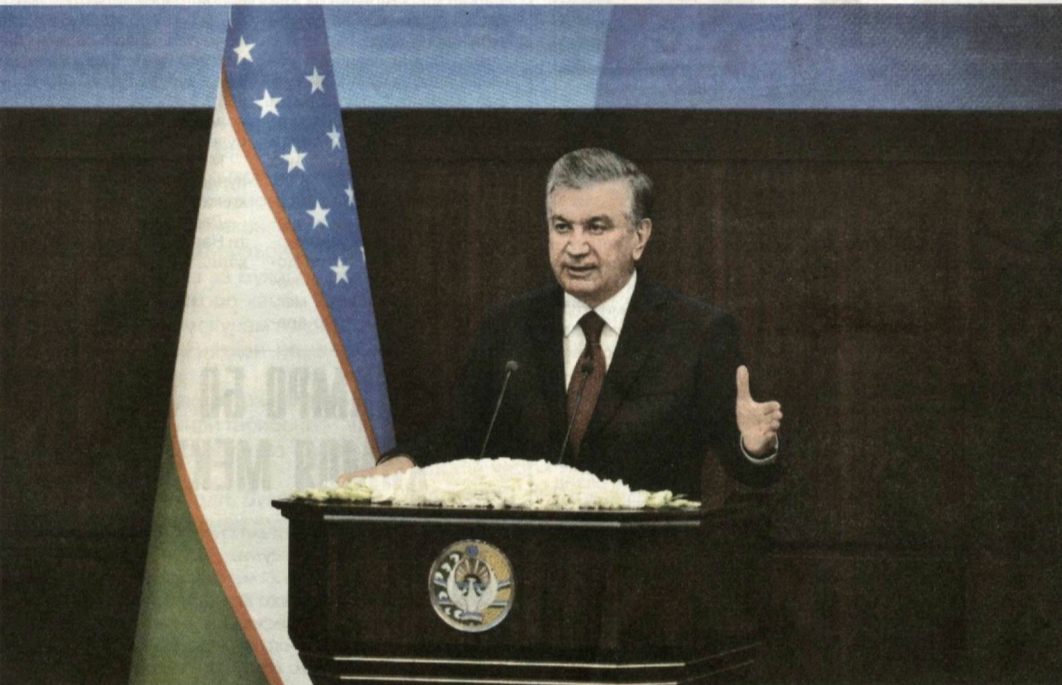
Президенти Ҷумҳурии Ўзбекистон, Сарфармондеҳи Олии Қувваҳои Мусаллаҳ Шавкат Мирзиёев 10 январ, дар арафаи Рӯзи муҳофизони Ватан ба Академияи Қувваҳои Мусаллаҳ ташриф овард.

Роҳбари давлатамон ба ин ҷо моҳи январии соли 2017 омада, оид ба дар пойгоҳи Омӯзишгоҳи олии қумондонии умумқушунии Тошқанд ташкил кардани муассисаи комилан нави таълимӣ супориш дода буд. Вақти зиёд нагузашта қарори дахлдори Президент қабул гардид ва омӯзишгоҳ ба Академияи Қувваҳои Мусаллаҳ, ки дар худ технологияҳои пешқадамтарин ва воситаҳои замонавии таълимро мӯҳассам гардондаст, таъдил дода шуда буд. Моҳи январии соли 2018 Сарфармондеҳи Олии бо фаъолияти академияи нави шинос шуда буд. Имрӯ дар академия шароити ва мазмуни қараёни таҳсил куллан тағйир ёфтааст. Дарсхонаҳо бо техникаи замонавии компютерӣ, таҷҳизоти таълимиву лабораторӣ мӯҳаққад гардонда шудааст. Маркази замонавии ситуатсионӣ, тренажерҳо ташкил карда шудааст. Соли гузашта бинобар навсозии академия қорҳо идома ёфта, объектҳои нави қад афрохтанд. Барои тағйири таълимиву ҳарбии курсантҳо, бо вариши шуғл варишидан онҳо имкони