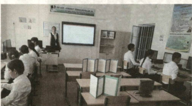
Училиштиноси мактабамон ба шумор меравад.

оаврд. Албатта, баъди захматҳои зиёд дидани самаран он ба кас ҳаловаат мебахшад.