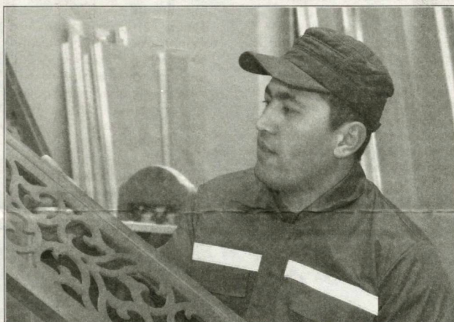
Дар қорхонае, ки фаъолиятгашро дар назди ҷамъияти масъулияташ маҳдуди «Firdavs production»-и маҳаллаи Ўртаққўрғони ноҳияи Шаҳрисабз ба роҳ мондааст, меҳелҳои замонавӣ истеҳсол карда мешавад. Қорхона дар ҳоли ҳозир беш аз 10 намуни махсулоти меҳелро истеҳсол менамояд. Махсулоти тайёрро ба бозори дохилӣ мебароранд. Дар ин ҷо 7 нафар бо шуғл фаро гирифта шудаанд. Дар акс: дар қорхонаи мазкур.