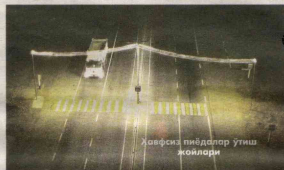
Хавфсиз пиёдалар ўтиш жойлари