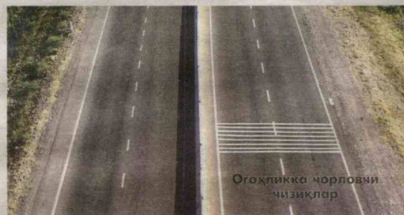
Оғоҳликка чорловчи чизиқлар

дан 6-километригача бўлган оралиғи қайта реконструкция қилиниб, икки полосали йўлдан биринчи тоифали олти полосали йўлга ўтказилмоқда. Мазкур йўл четидан эса пиёдалар ва велосипед ҳайдовчилари учун 12 километрлик алоҳида йўлаклар ташкил этиляпти. Бу йўлакчалар қатнов қисмидан анча ичкарида жойлашган бўлиб, хавфсизлик талабларига тўлиқ жавоб беради.