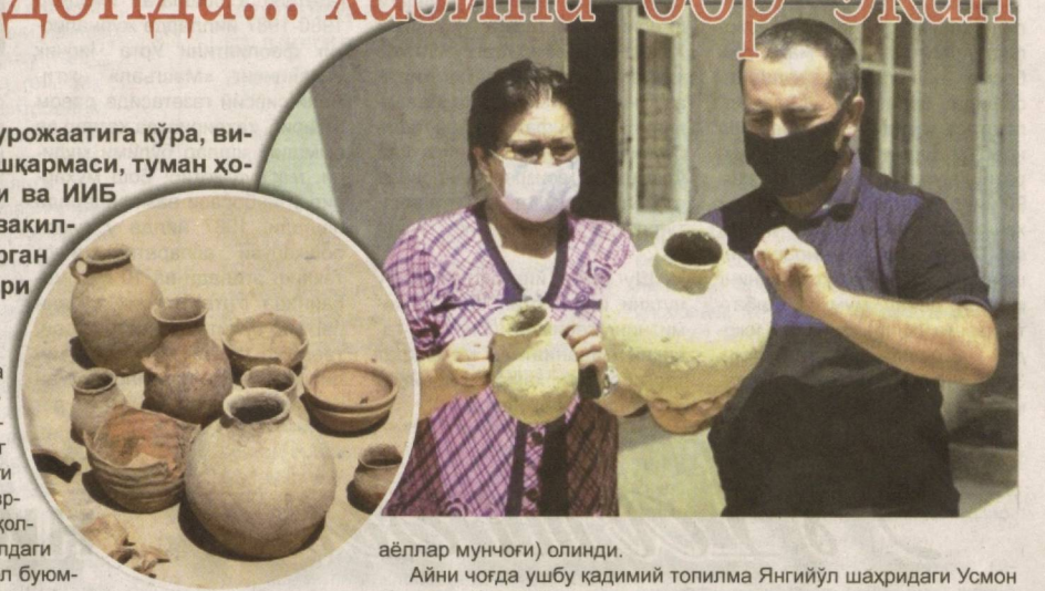
аёллар мунчоги) олинди. Айни чоғда ушбу қадимий топилма Янгийўл шаҳридаги Усмон Юсупов уй-музейига далолатнома асосида топширилди.

Дастлабки ўрганишларга кўра, ушбу қабр «Қовунчи» маданиятига оид бўлиб, у миллоддан аввалги III, миллоднинг III-IV асрларига оид эканлиги қайд этилди. Қабрдан ўша даврда яшаган одамларнинг суяк қолдиқлари (1 та скелет) ва 9 хилдаги турли ҳажм ва шаклдаги сопол буюмлари (1 донаси синик ҳолда ҳамда 1 дона