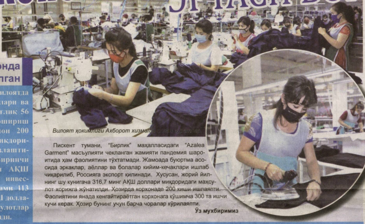
Вилоят ҳокимлиги Ахборот хизмати тўғрисида маълумотлар

Ж орий йилда вилоятда саноат корхоналари ва тадбиркорлик билан боғлиқ 56 та лойиҳани амалга ошириш ҳисобига 309 миллион 200 минг АҚШ доллари миқдоридаги инвестицияни ўзлаштириш кўзда тутилган. Биринчи чоракда 52,5 миллион АҚШ доллари миқдоридаги инвестиция жалб этилиб, жами 113 миллион 400 минг АҚШ доллари кийматидаги маҳсулотлар четга экспорт қилинди.