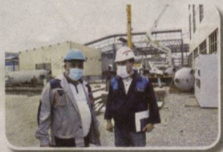
янги 7-моносекция қурилади ҳамда 5-моносекцияга қўшимча тармоқ бириктирилади.

Ҳозирги пандемия даври қийинчиликларига қарамай, Олмалиқ кон-металлургия комбинати томонидан барча йирик инвестиция лойиҳалари изчил амалга оширилмоқда. Хусусан, "Олмалиқ ОКМК" АЖ асосий ишлаб чиқариш кувватларини реконструкция қилиш ва барқарорлаштириш дастури"га асосан, 2019-2022 йилларда Мис бойитиш фабрикаси, Мис эритиш ва Рух заводлари кувватларини модернизация қилиш ва янгилаш ишларига 357,5 миллион АҚШ доллари сарфланиши кўзда тутилган. Ҳозирда ушбу объектларда таъмирлаш ва тиклаш, қурилиш-монтаж ишлари олиб борилаёпти.