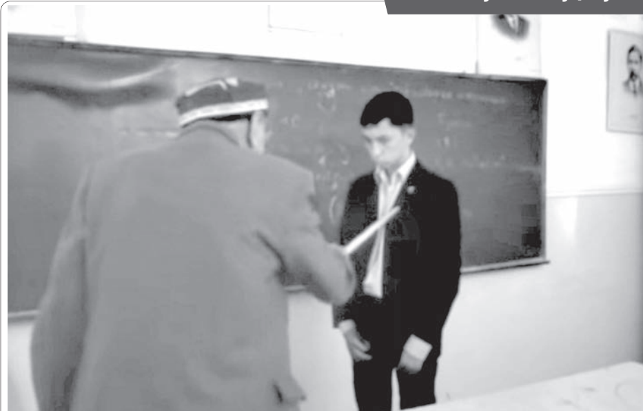
«Кичкина одамлар» кинофильмидан лавҳа.

Аммо ўқитувчининг ойлиги ўзининг олдинги миқдорига нисбатан ошди. Бошқа касб эгаларига ёки бозор муносабатларига кўра эмас. Кун келиб ўқитувчи минг доллар ойлик ола бошласа, бошқа соҳа вакиллари ойига камида ўн минг доллар даромад қила бошласа, бу билан ўқитувчи хурсанд бўладими?