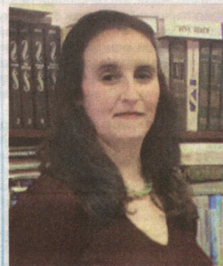
Келси Эрин ШИПМАН, АҚШ ёзувчиси ва педагоги: