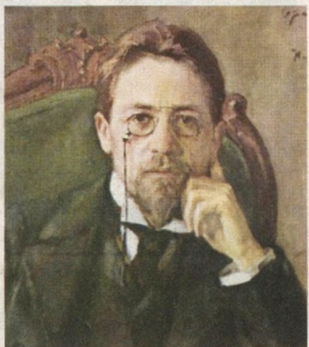
Антон ЧЕХОВ, (1860–1904) рус адаби