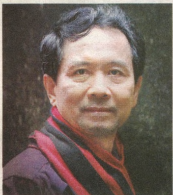
Май Ван ФАН (1955), таниқли вьетнам шоири