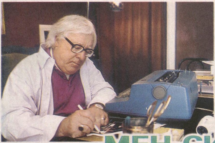
Рэй БРЭДБЕРИ (1920–2012), АҚШ ёзувчиси

Мен сизнинг ёшлигингизга ҳавас қиламан. Агар ёшликка қайтиш ва ҳаммасини қайтадан бошлаш имкони бўлганда, мен иккиланмай яна шу йўлни танлардим.