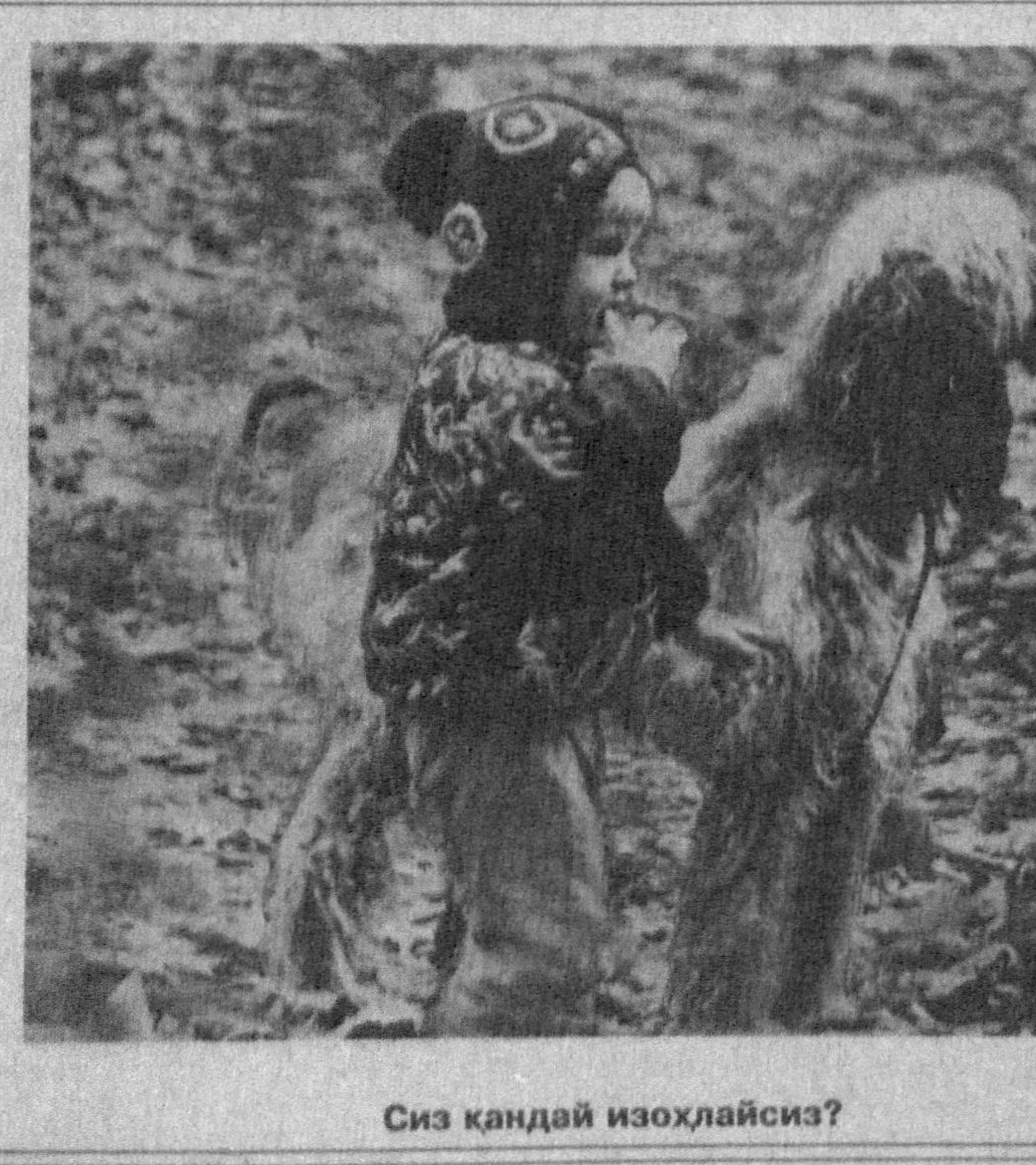
Сиз қандай изоҳлайсиз?

Тоҳмаҳални ҳақли равишда учун ер қурасидаги жамики одамлар бирварақайига ишга тушган ҳолда 200 миллиард йил давомида донларини у хо-надан бу хонага суришлари ло-зим экан. Бу сеқундига минг-минглаб операция бажарадиган ҳозирги замон электрон ҳисоб-лаш машиналари учун ҳам бир неча йил давомида бажарила-диларни мафтун айламоқда. Зотан, шўмот инсон қалби-дан қайнаб чиққан тўйгулар, ёл-қилли ҳислар, ақл билан, та-факкур билан омухталлашиб ке-тган. Шўмот тахтасининг хар бир катағида сирли олам яши-ринган гув. У кишини мулоҳа-за тарозусида тортилган фикр-лар, жўшқин ҳислар гирдобига, кураш майдонига етаклайди.