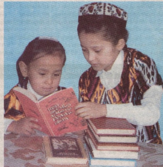
«Орзуларим бир жаҳон, Пойдевор унга китоб».