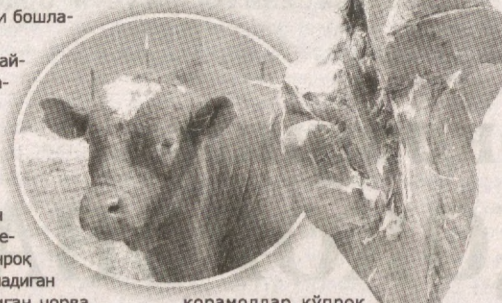
қорамоллар кўпроқ маҳсулдор ҳисобланади.