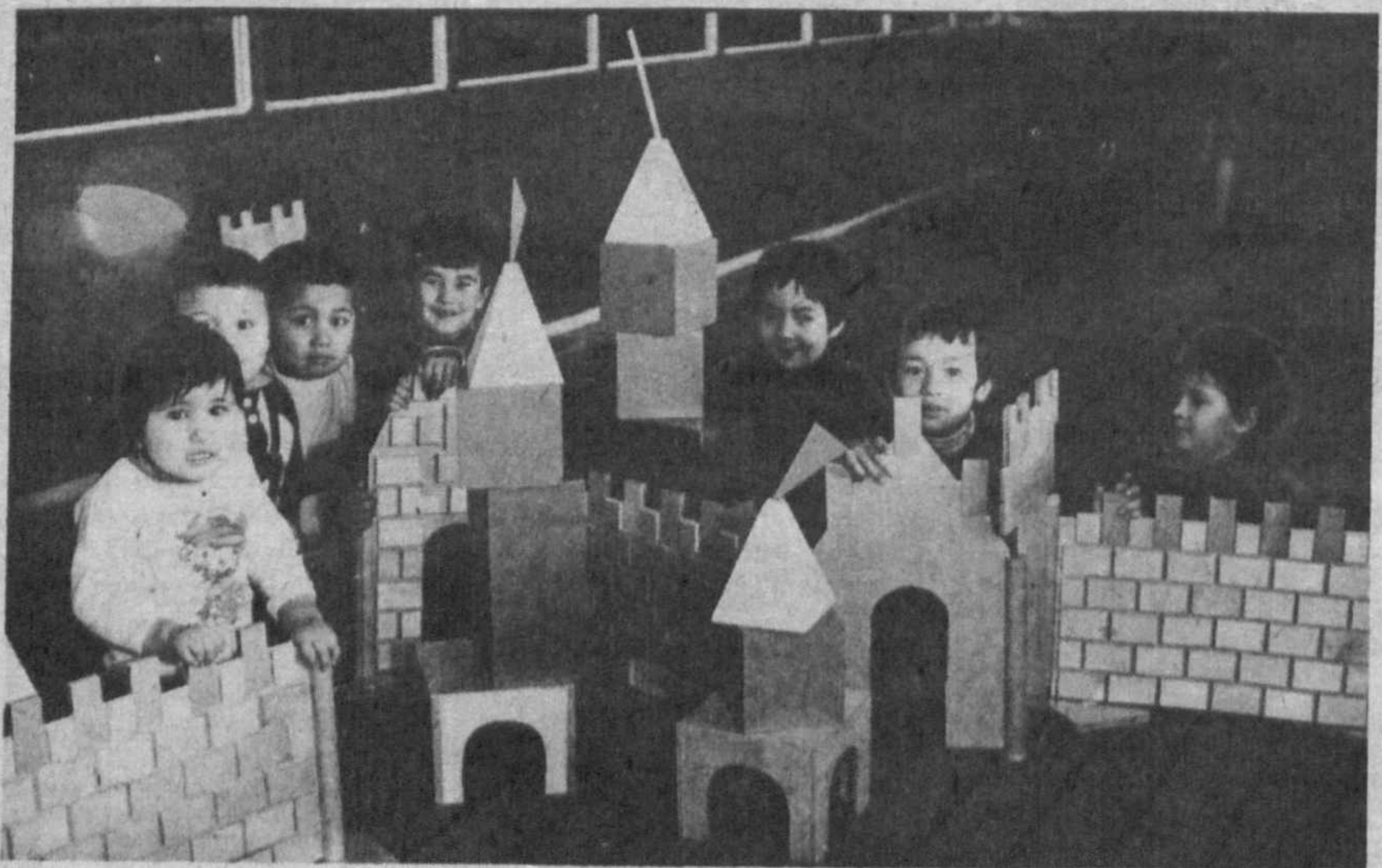
Мы строили, строили и, наконец, построили!