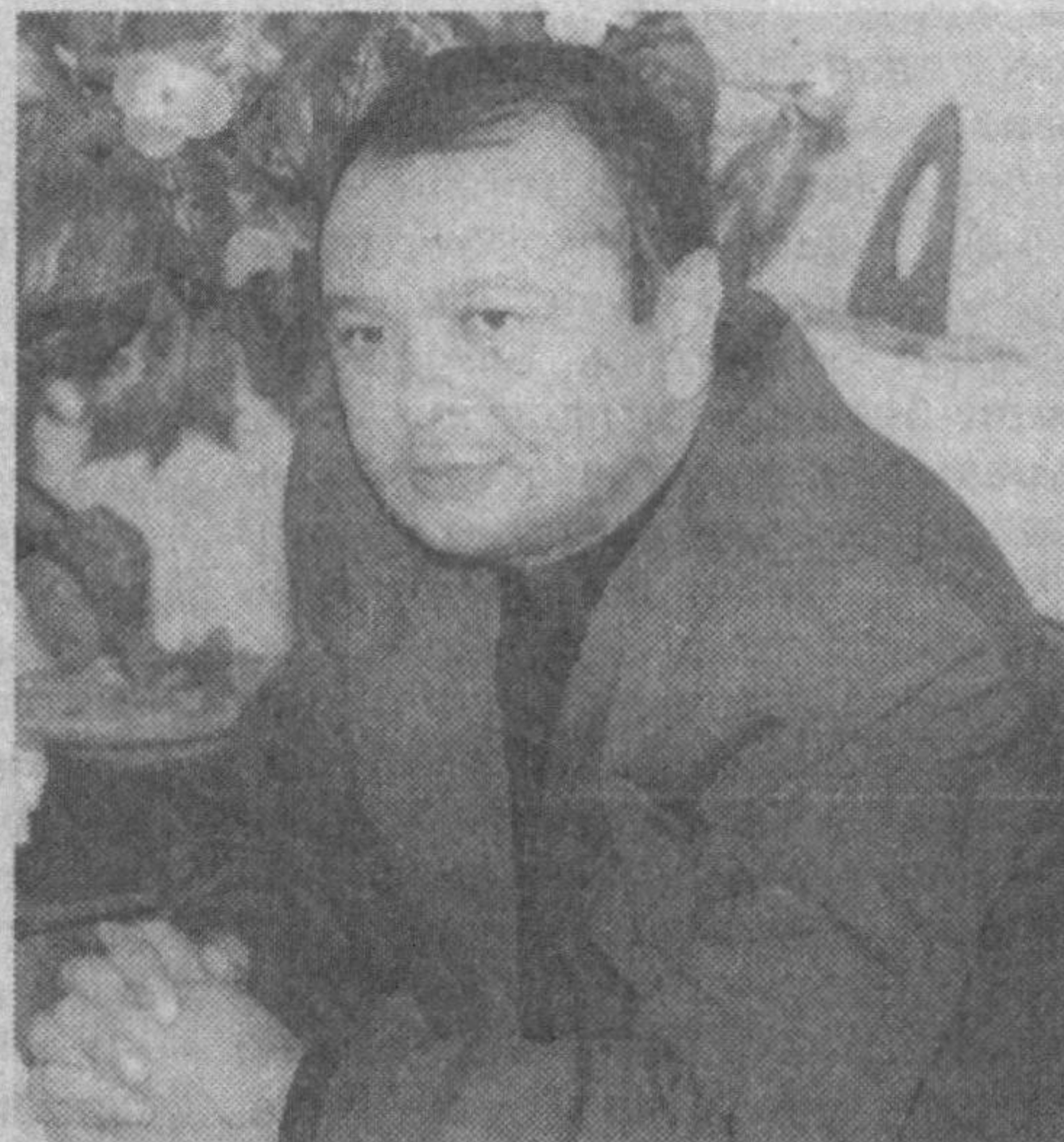
Уйқусида уйғоқ мудом олов ақли, Симоб янглиғ бесаришта ҳеч тичимас. Худога ҳам эркаланар гўлдакдайн, Ҳамиша шу, ҳамиша шу, аксинчамас.

Туядайин кечалари, чўкаверар, Ўрқачида думалоқ ой тақсимчадай. Синқорса у умрларини синқорали, Ҳамиша шу, ҳамиша шу, аксинчамас. Теша уриб тош йўнади вақтзодалар, Мангунлиқнинг гўшасида ханда тинмас. Хисобига етиб бўлмас арш кулларини, Ҳамиша шу, ҳамиша шу, аксинчамас. Ноқис доно уммонидан хўлолмайди, Нопок ҳақнинг китобини ўқиймас. Ҳеч ким нури бир нуқтага тўллолмайди, Ҳамиша шу, ҳамиша шу, аксинчамас.