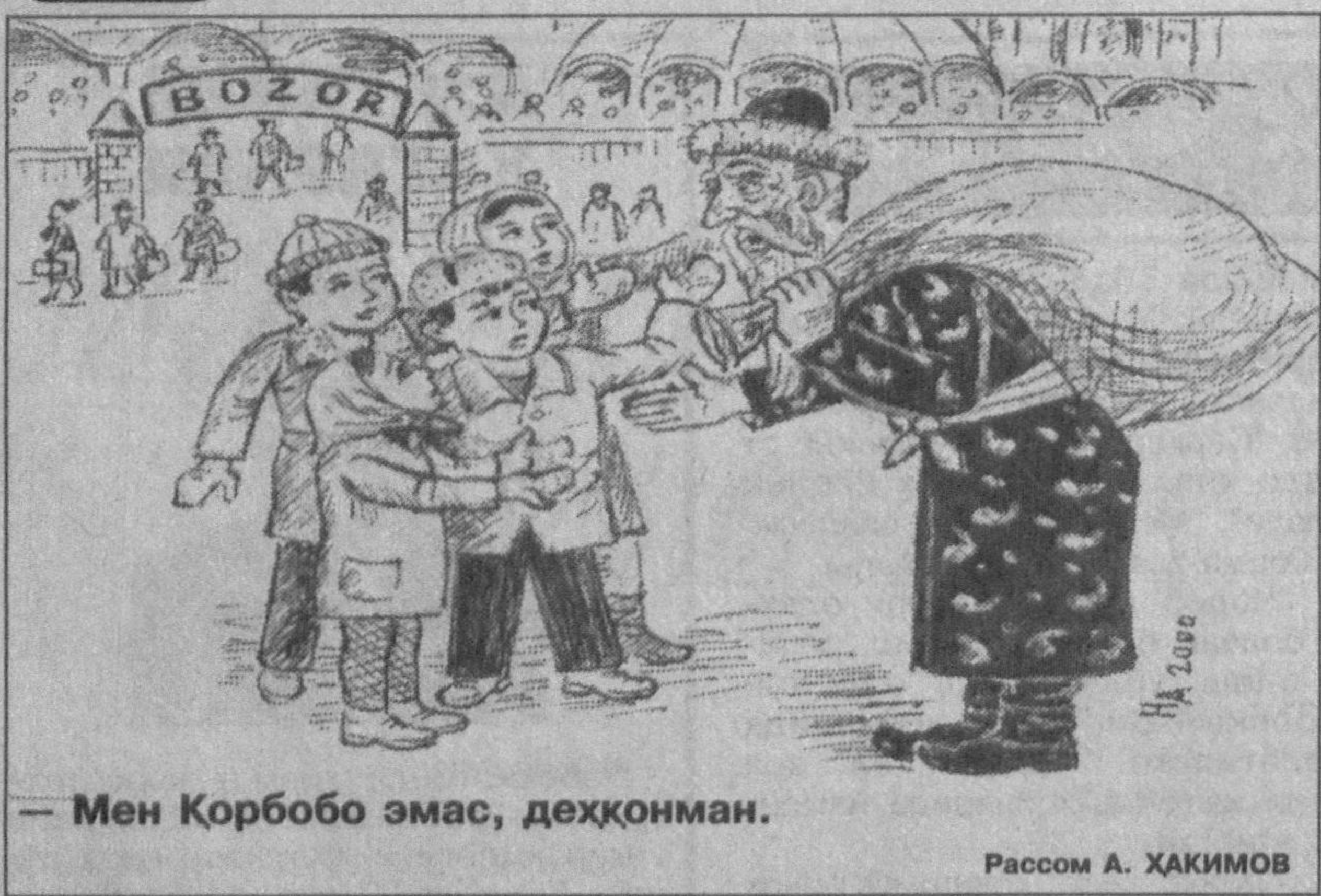
— Мен Қорбобо эмас, дехқонман.