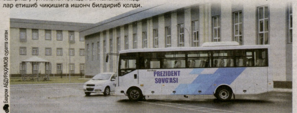
Баҳром АБДУРАҲИМОВ суратга олган