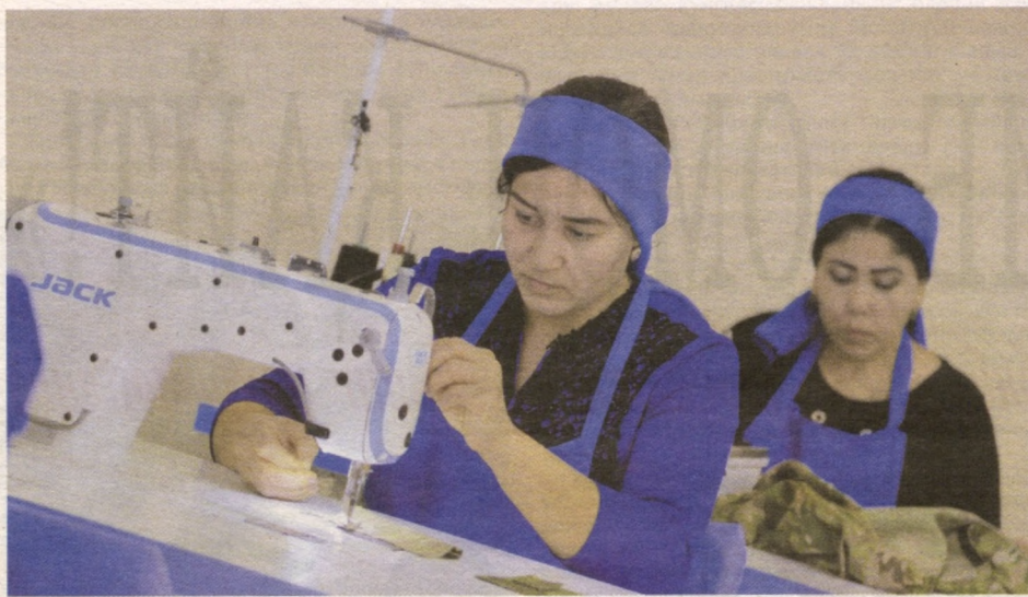
Муаллиф бугунга олган

аҳолиси эҳтиёжини қондирыпти. Шинам ошхона ошпазлари, қўли ширин новвойлар ҳалол хизмати, юмушига муносиб маошидан барака топмоқда.