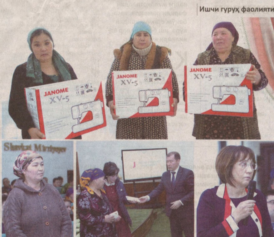
Ишчи гуруҳи фаолияти

Мамлакатимизда хотин-қизларнинг ижтимоий аҳволини яхшилаш, бандлигини таъминлаш, даромадларини кўпайтириш, уларнинг муаммоларини ўрганиш ва ҳал этиш, моддий ва маънавий қўллаб-қувватлашга қаратилган чора-тадбирларни амалга ошириш бўйича республика ишчи гуруҳи навбатдаги фаолиятини Пахтакор туманида олиб борди.