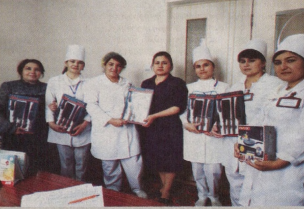
500 минг сўм миқдориди рағбатлантирилди. Мустақиллик байрами муносабати билан 75 нафар ходим совғалар билан тақдирланди.

Пандемия шароитида ходимлар саломатлигини муҳофаза қилишга алоҳида эътибор қаратилмоқда. Шу мақсадда 2 миллион 600 минг сўмликдан зиёд гигиеник воситалар, 3 миллион сўмликдан ортиқ бир мараталик қўлқоплар тарқатилди. Тури байрамлар, ҳайит айёмлари муносабати билан ходимларга моддий ёрдам кўрсатиш анъанага айланган. Рамазон ҳайити муносабати билан 22 нафар ходимга беш миллион сўмлик моддий ёрдам кўрсатилган бўлса, Қурбон ҳайитида 5 нафар ишламайдиган пенсионерларга икки миллион сўмлик моддий ёрдам кўрсатилди. 8 нафар ижтимоий ҳимояга муҳтож ходимга уч миллион сўм моддий ёрдам пули берилди. 2 нафар касаба уюшма фаоли