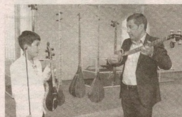
» Назм ва наво

Ўзбекистон Республикаси Президенти Ш. МИРЗИЕВ Тошкент шаҳри, 2020 йил 4 февраль