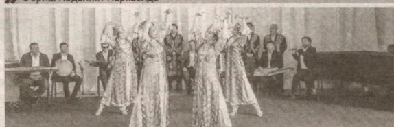
» Форш маданият марказида

2018 йил 30 ноябрда Ўзбек миллий мақом санъати маркази ва Сурхондарё вилояти намунали “Мақом” ансамбли билан ҳамкорликда вилоятдаги мухташам санъат саройида илж маротаба “Мақом кечаси”ни ўтказишган эди. Концерт воҳа аҳлида катта таассурот қолдирди. Бундан рухланган жамоа яна янги асарларни ўрганиб, 2019 йил 14 февралда Сурхондарё санъат саройида Ўзбекистон давлат консерваториясининг “Анъанавий хонандлик” кафедраси билан ҳамкорликда “Назм ва наво” кечасини ўтказди. 2019 йил 24 декабрда эса ҳисобот концертини намойиш этди. Мақомларимизни келажак авлодга безавол етказиш, уларни катта-катта саҳналарга олиб чиқиш, телевидение ва радионинг олтин фондларидан жой олиш, мақом санъатини юртимизда ва чет элда кўпроқ тарғиб этиш ансамблнинг бош мақсадиридир.