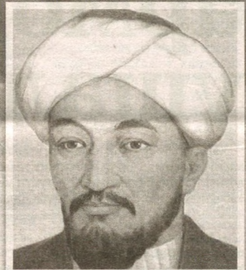
Олимлардан бири Герберт Спенсер бу ҳақда шундай дейди: "Тарбия таълимдан устун туради. Инсонни тарбия вояга етказиши" .

қадрият ҳисобланади. Бунга оналаримиз томонидан айтиладиган алла, комил инсон руҳи йўғрилган эртақлар мисолдир. Уларни тинглаб улғайган гўдак аждодлар меҳрини туяди, муносиб бўлишга ҳаракат қилади, баркамолликка интилади. Бу бизнинг бола тарбиясида азалдан тутиб келаятган йўлимиздир.