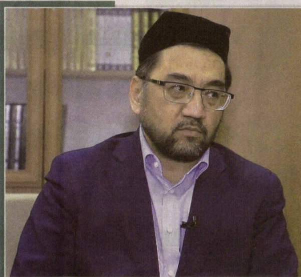
Нуриддин домла ХОЛИХАЗАРОВ, Тошкент шаҳар бош имом-хатиби: