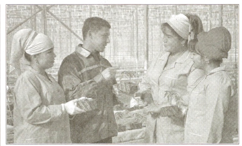
Гармхонаи нави замонавӣ, ки дар назди заводи севенти Шерободи ҷамъияти сахҳомии «Комбинати металлургияи кўҳи Олмалик»-и ноҳияи Шеробод барпо гардидааст, дар асоси технологияҳои компютерӣ идора карда мешавад. Дар гармхонае, ки як гектар майдонро дар бар гирифтааст, барои содирот беш аз 21 ҳазор бех қўчати помидорӣ содиротӣ парвариш карда мешавад. Дар ин ҷо 25 нафар занону духтарон ва қавонони деҳоти Оқтош, Вандоб, Пошхўрд ва Тузқон бо шугл фаро гирифта шудаанд. Бино ба гуфти дастандаркорон ҳосили аввал дар арафаи ҷашни Наврўз ҷамъовари гардида, ба фармоишгариҳои хориҷӣ интиқол дода мешавад. Дар акс: дар гармхона.

Боз як мушкилоте, ки аҳолии маскунӣ ин маҳалло ба таъмиш меоварад, ҳолати таъминоти қувваи барқ мебошад. Бо назардошти ин таҳти роҳбарии кормандони масъули ҷамъияти сахҳомии «Худудӣ электр тармоқлари» гуруҳи қорӣ ташаккул ёфт. Таъри ки маълум гардид, дар натиҷаи ба шиддати баланд қор кардани нуқтаҳои трансформатории деҳа ва сол аз сол зиёд шудани аҳолии ба баъзе хонаҳо иқтисоди қувваи барқ аз