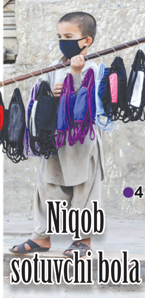
●4 Niқob sotuvchi bola

– Ассалому алайкум амаки, ниқоб олмайсизми? – Ваалайкум ассалом, болакай пулим йўқ-да. – Олаверинг, сизга текинга бераман. – Ойинг уришмайдими текинга берсанг?