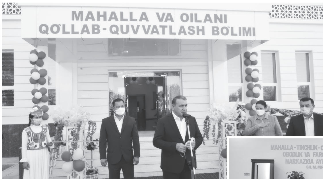
Қорақалпоғистон Республикаси Амударё тумани Маҳалла ва оилани қўллаб-қувватлаш бўлимининг янги биноси фойдаланишга топширилди.

Шу муносабат билан ташкил этилган тадбирда Ўзбекистон Республикаси Маҳалла ва оилани қўллаб-қувватлаш вазири Р.Маматов, Қорақалпоғистон Республикаси Маҳалла ва оилани қўллаб-қувватлаш вазири С.Турманов, Амударё тумани ҳокими С.Йўлдошев ва кенг жамоатчилик вакилла-