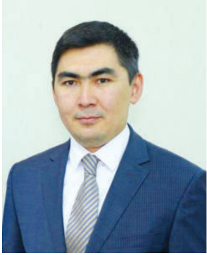
Оттабек ҲАСАНОВ, Ўзбекистон Республикаси Президентини ҳузурдаги Давлат хизматини ривожлантириш агентлиги директорининг биринчи ўринбосари