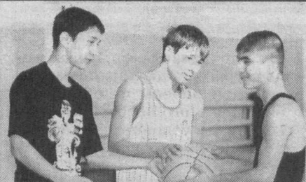
Коллективная игра рождает взаимовыручку.