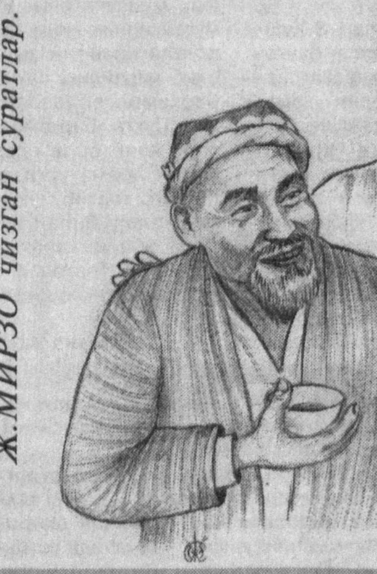
Ж.МИРЗО чизган суратлар.

«Мис чавандоз» «Қил кўприк»дан эсон-омон ўтиб «Сўнгги бекат»га етиб келди.