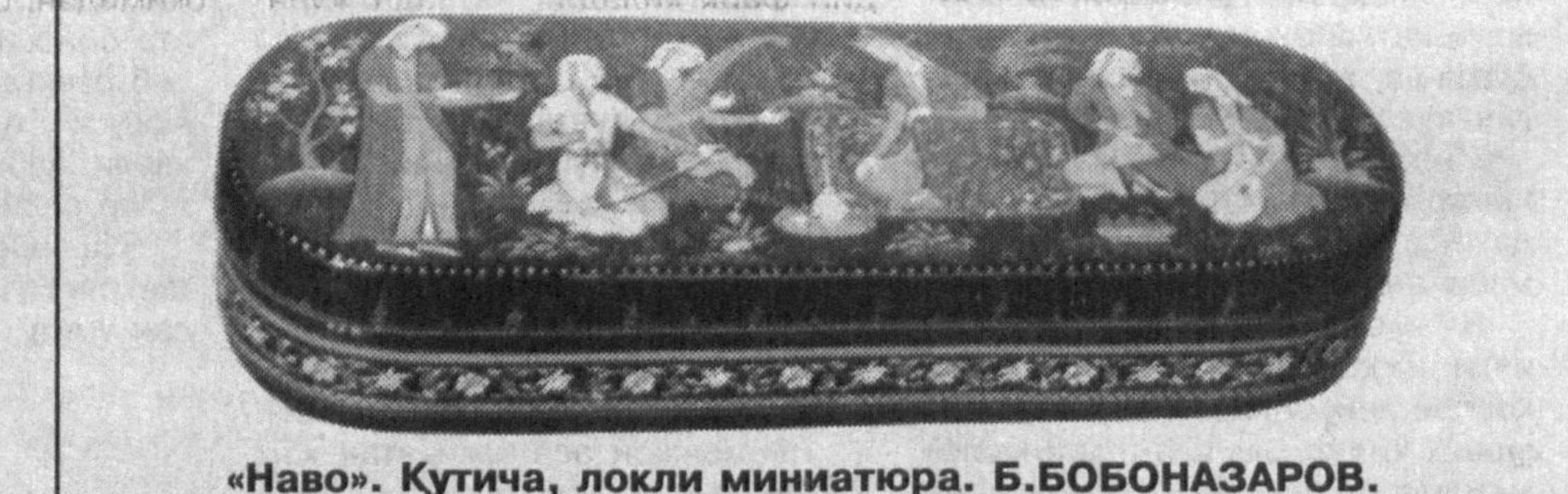
«Наво». Қутича, лоқли миниатюра. Б.БОБОНАЗАРОВ.