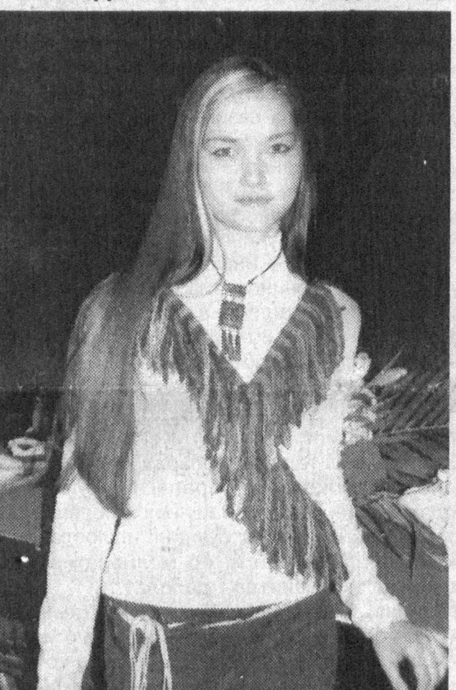
СУРАТЛАРДА: Танлов иштирокчилари.