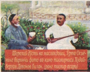
Шерозий дўсти ва мастаҳбодши, Ўрта Осиёнинг биринчи фото ва кинотасвирчиси Худайберган Девонов билан. (1912 йил тасвир асари)

Қадимий музей-шаҳар Хивада, “Ичан-қалъа” марказида мезморий ёдгорлик Қози Калон мадрасаси бор. Бу тарихий бинода ҳозирда музей-қўриқxonанинг “Хоразм муסיқа тарихи” бўлими жойлашган. У ерда Шерозий ҳаёти ва ижодий фаолиятини акс эттирувчи экспозиция ташкил этилган. Бундаги ноқир экспонатлар ташриф буюрувчиларнинг алоҳида эътибор ва қизиқишига сазовор бўлмоқда.