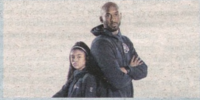
Интернет хабарлари асосида тайёрланди

TMZ нашрининг маълум қилишича, вертолётда Кобедан ташқари унинг 13 ёшли қизи Жанна ҳам бўлган. Кобе кизи билан баскетболга ихтисослашган «Мамба академияси»га учиб кетаётган эди.