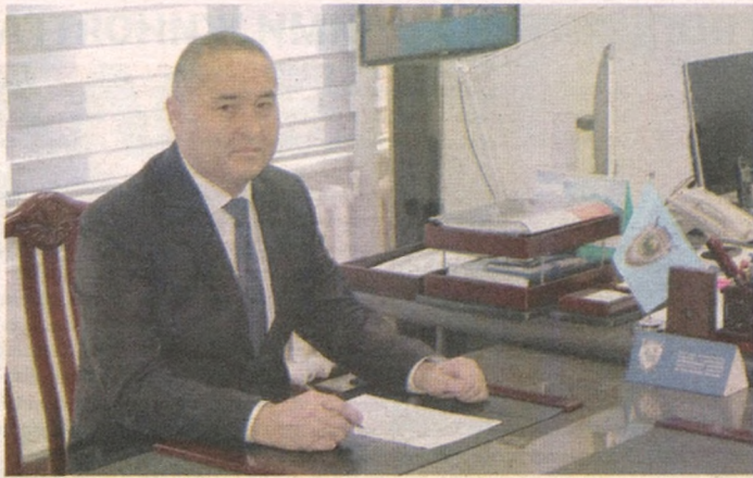
Гайратжон ФОЗИЛОВ, Андижон вилояти прокурори