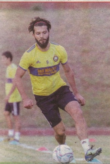
Интернет хабарлари асосида тайёрланди

Манбанинг маълум қилишича, «Трабзонспор» клубининг собиқ футболчиси Шота Арвеладзе бошқараётган «Пахтакор» клубидаги яримҳимоячи Жалолiddин Машарипов Европага йўл олиши ва «Трабзонспор» либосини кийишни хоҳламоқда. «Шерлар» футболчи учун Туркия клубидан 2 миллион евро сўраган. «Трабзонспор» клуби эса Жалолiddин учун сўралган пулни беришга тайёр.