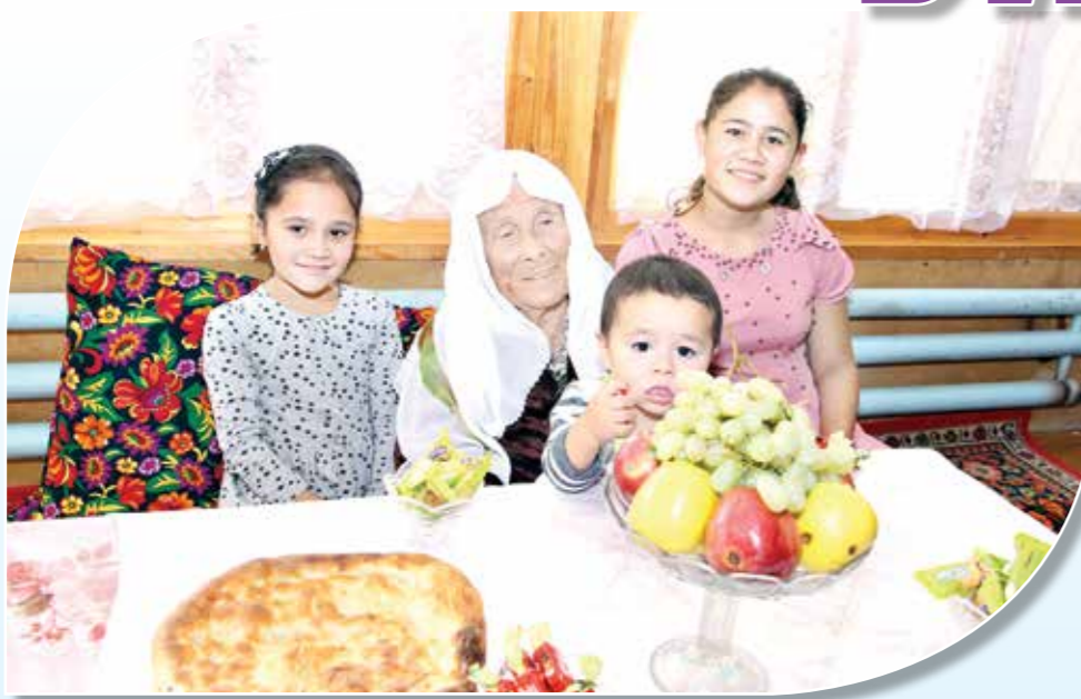
Онахон юз ёшдан ошган бўлсаларда, кўз тегмасин, ҳали ҳам тетилар. Хонадонларига йўқлаб борганимизда биз билан беамалол суҳбатлашиб, ўз ҳаётлари

ҳақида гапириб бердилар. — Шукр, шундай дориламон замонда яшаш менга ҳам nasib қилди, — дейди Хижола ая. — Қаранг, бугун юртимиз тинч, ҳаётимиз фаровон. Афсуски, бугун айрим ёшларимизга сабр-қаноат етишмаяпти. Шу сабабли, акрашиб кетаётган оилалар кўп. Баъзи келинлар меҳнатга, озгина қийинчиликка чидагиси келмайди. Ахир, меҳнат бахт, роҳат ва саломатлик олиб келадику. Биз очарчилик ва бошқа қийинчиликларни бошдан кечирганимиз. Шунда ҳам меҳнат қилишдан қочмай, ҳаётнинг аччиқ-чучуғини оила билан бирга енгдик.