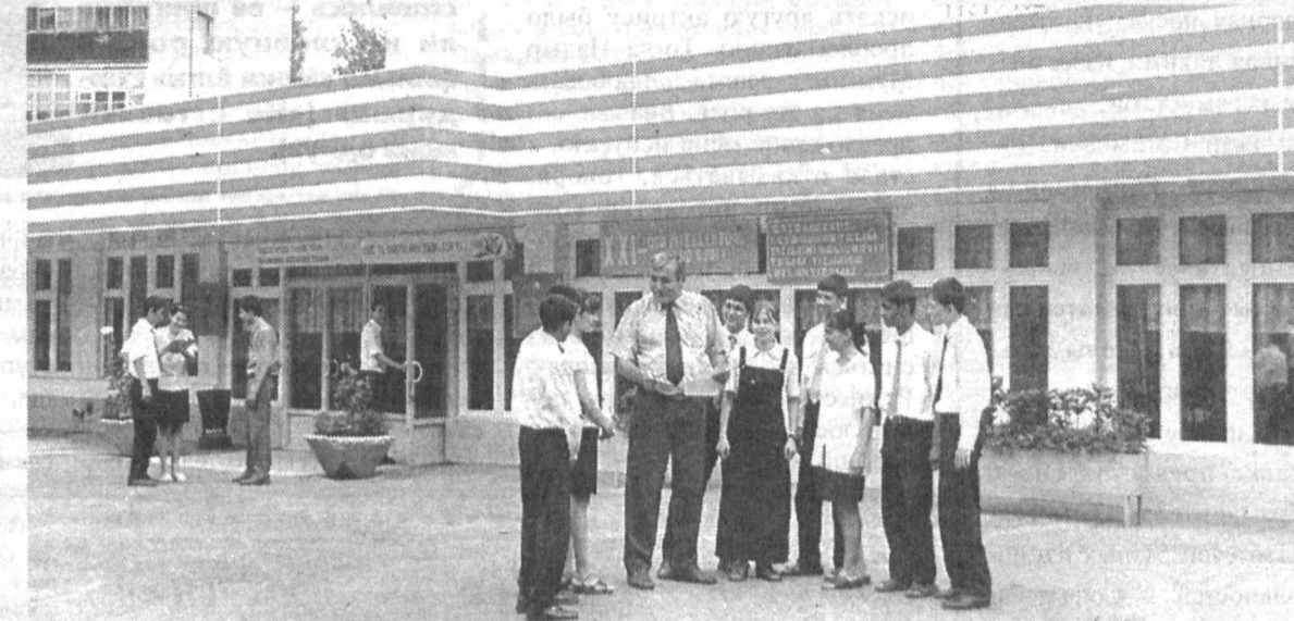
В Мирзо-Улукбекском промышленном профессиональном колледже практически завершилась работа консультативного центра.