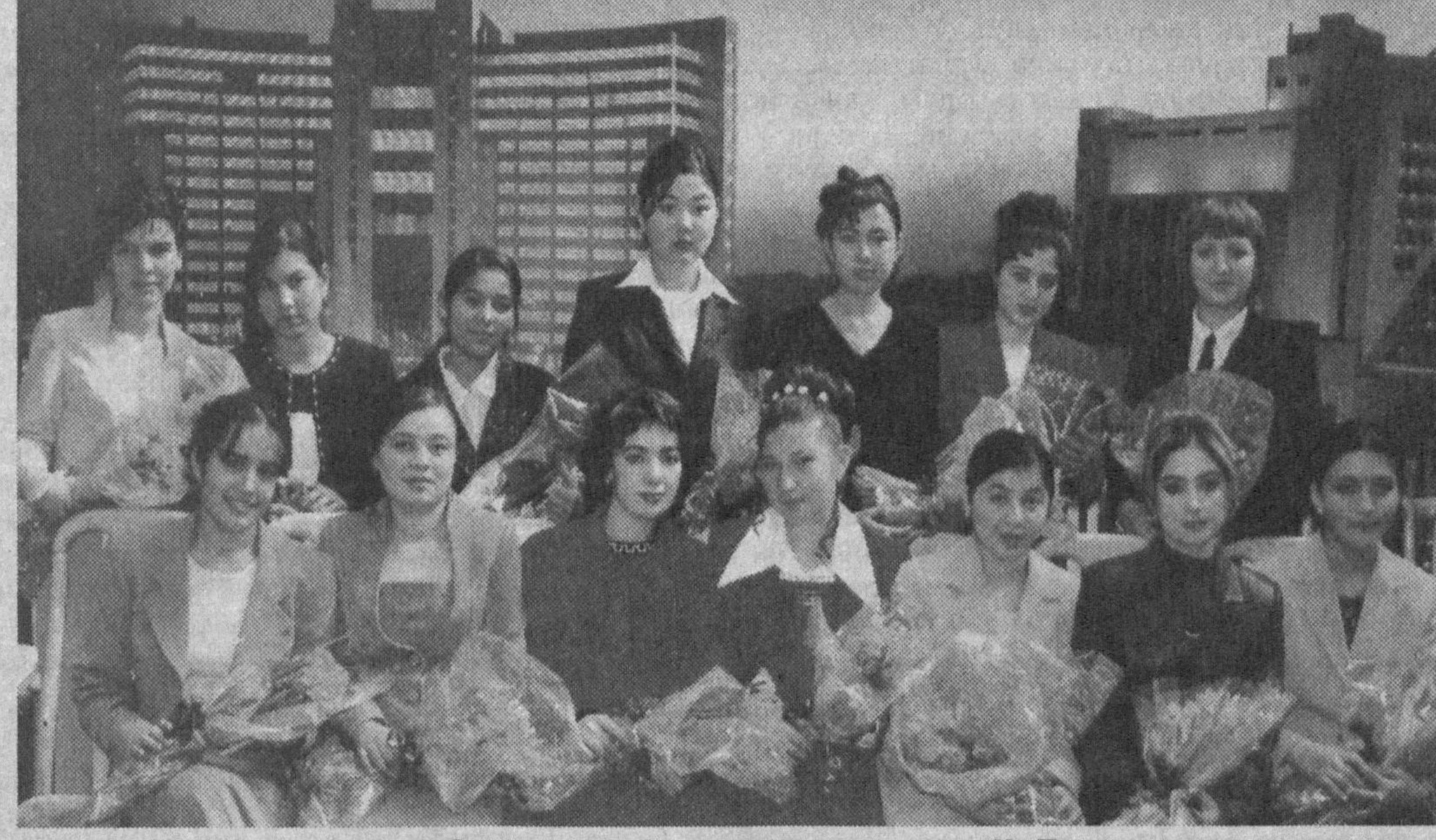
Суратга: Зулфия номидаги Давлат мукофоти совриндорлари. Ҳ. Пайзаев олган сурат.

дарди ва завқини қалб билан туйишнинг эзу олари, илҳомли дақиқалар беиз ўтмайди.