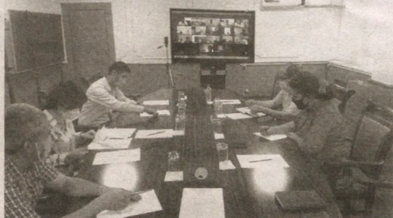
Таъкидланганидек, Ўзбекистонда коррупциянинг олдини

“Ўзбекистон почтаси” АЖнинг Коррупцияга қарши курашиш бўйича комиссия ташаббуси билан Жамият ижроия аппарати ва филиаллари мутасадди ходимлари иштирокида соҳада коррупцияга қарши курашиш бўйича “Рақамли технологиялар — коррупция кушандаси” мавзусида видеоконференция бўлиб ўтди.