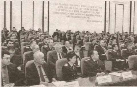
Давоми. Бошланиши 1-бетда

Маълумки, мамлакатимизда олий таълим соҳасини ривожлантиришга жуда катта эътибор қаратилмоқда. Сўнгги уч йилда олий таълим соҳасига оид 200 дан ортик қонун ҳужжати қабул қилинди.