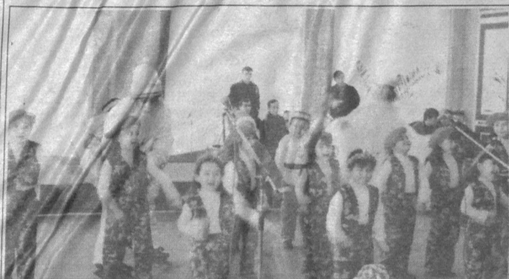
СУРАТЛАРДА: Янгийул шаҳрида бўлиб ўтган «Президент арчаси» байрамидан лавҳалар.