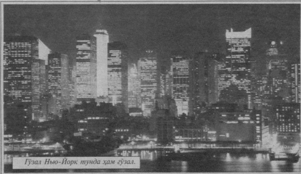
Гўзал Нью-Йорк тунда ҳам гўзал.

«Қалдирғоч» росмана автомобиль эса парижлик Николас Жозеф Кунё (1725 – 1804) томонидан 1769 йилда яратилди. Соатиға 3,6 километр тезликда ҳаракат қилишга қодир мазкур «оқсоқол» автомобиль айна чоқда Париждаги музейлардан бирида сақланмоқда.