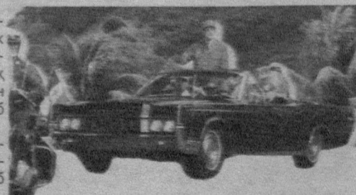
(ЖАҲОН ОММАВИЙ АХБОРОТ ВОСИТАЛАРИ ХАБАРЛАРИ АСОСИДА ТАЙЁРЛАНДИ).

Шустерга ҳам қойил қолиш керак. У асирликда ўзини йўқотиб қўйгани йўқ. Саёҳат пайти кинокамерани қўлдан қўймайдиган президент асирликда вақтини бекор ўтказмай, Амазонканинг ёввойи табиати, ажабтовур ҳайвонот олами, ноёб ўсимликлари ҳамда хиндуларнинг урф-одатлари, маросимларини суратга олди. Энди Словакия раҳбарининг ҳаёти ва президентлик фаолияти ҳақида олинажак ҳужжатли фильмга Амазонка чангалзорларидаги саргузаштлар ҳам қизиқарли материал бўлиб қўшилса, ажаб эмас.