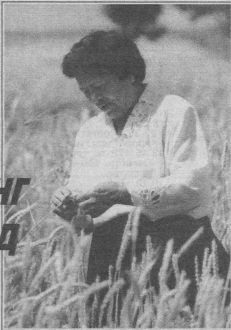
мустақил Ўзбекистонимиз қишлоқ хўжалигига юқори малакали кадрлар тайёрлашга бағишлаётир.

Бугунги кунда наинки мустақил Ўзбекистонда, балки олис-яқин хорижий мамлакатларда ҳам профессор Ҳалима Отабевани яхши танишади. Ўсимликшунос олиманинг галла ва озуқа экинлари ҳосилдорлигини ошириш, оқсилга бой ўсимликлар майдонини кенгайтириш муаммоларига бағишланган илмий ишланмалари мамлакатимиз иқтисодиётини кўтаришда салмоқли ўрин тутмоқда.