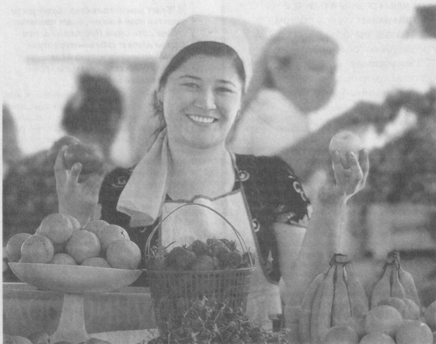
■ Прилавки на рынках нашей страны изобилуют сельскохозяйственной продукцией. Дехканские рынки Наманганской области - не исключение.

Постановление Президента нашей страны "О мерах по совершенствованию системы закупок и использования плодоовощной продукции, картофеля и бахчевых культур" от 12 апреля этого года способствует дальнейшему расширению снабжения потребительского рынка свежей плодоовощной и бахчевой продукцией на протяжении всего года.