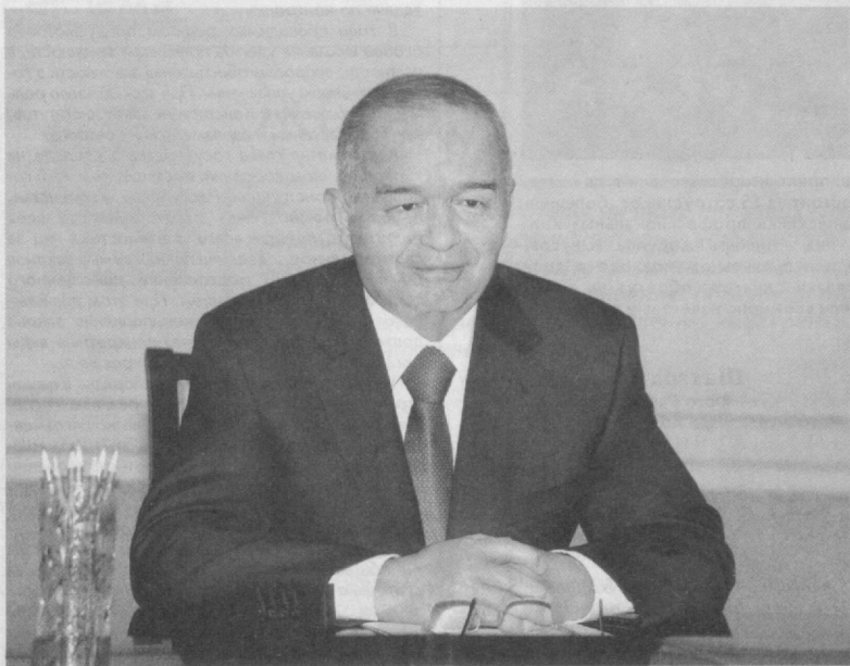
Президент Республики Узбекистан Ислам Каримов 23 мая в резиденции Оксарой принял министра иностранных дел Китайской Народной Республики Ван И, находящегося в нашей стране с официальным визитом.