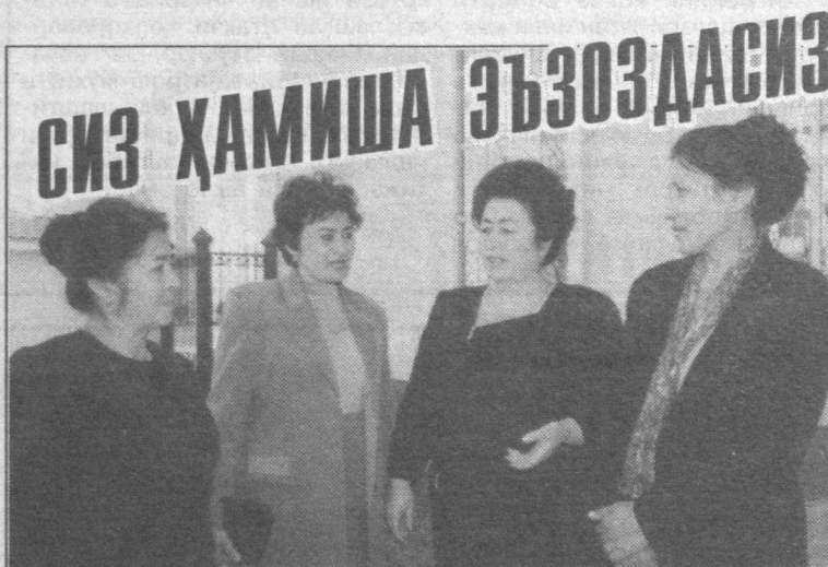
Тошкент вилояти хотин-қизларининг 8-март байрамига бағишланган тадбирда бу сўзлар кўп бора тилга олинди

Ўзбекистон томони АҚШ билан нафақат хавфсизликни таъминлаш ва халқаро терроризм, наркотрафик ҳамда бошқа хавфларга қарши кураш масалаларида, балки инсон ҳуқуқлари ва эркинликлари, сиёсий ва иқтисодий ислохотлар соҳаларида ҳам ҳамкорликни янада чуқурлаштириш ва кенгайтиришга катта аҳамият бермоқда. Бу соҳаларнинг ҳар бири мамлакатларимиз ўртасидаги икки томонлама ва кўп томонлама муносабатларнинг муҳим таркибий қисмига айланиши лозим.