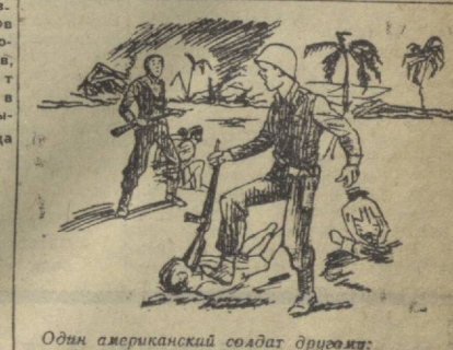
Один американский солдат дружит: — Эти вьетнамцы, наверное, не знают, что это срывается за их освобождение. Рисунок из газеты «Уорнер».

АЛЖИР, 14 июля. (ТАСС). Более 1.000 гектаров леса уничтожено во время пожара, вспыхнувшего недавно в пригороде Зарифет, недалеко от города Тлемсена. Это уже третий пожар за последние несколько дней в этом районе. Причиной пожаров является сильная жара.