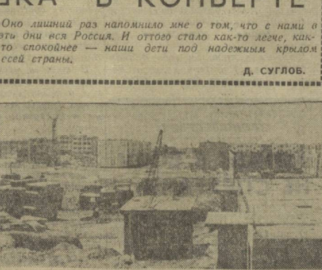
Быстрыми темпами ведется строительство Высоковольтного жилого массива. Здесь дома сооружают рука об руку с ташкентскими строителями отряды добровольцев из многих городов Узбекистана. На снимке: вид на строительство третьего сектора.