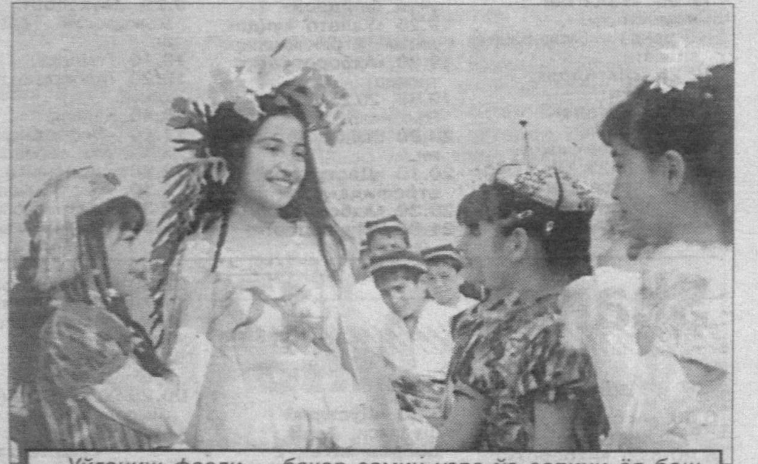
Йўғониш фасли — баҳор замин узра ўз сепини ёя бошлади. Атроф яшиллик сари юз тутиб, инсонлар қалбидеги эзгулик булоқларининг кўзлари очилмоқда.

Муҳаббат, меҳр-оқибат ва садоқат туйғулари элчиси бўлган баҳор бутун борлиқни яшнатмоқда, янгиламоқда.