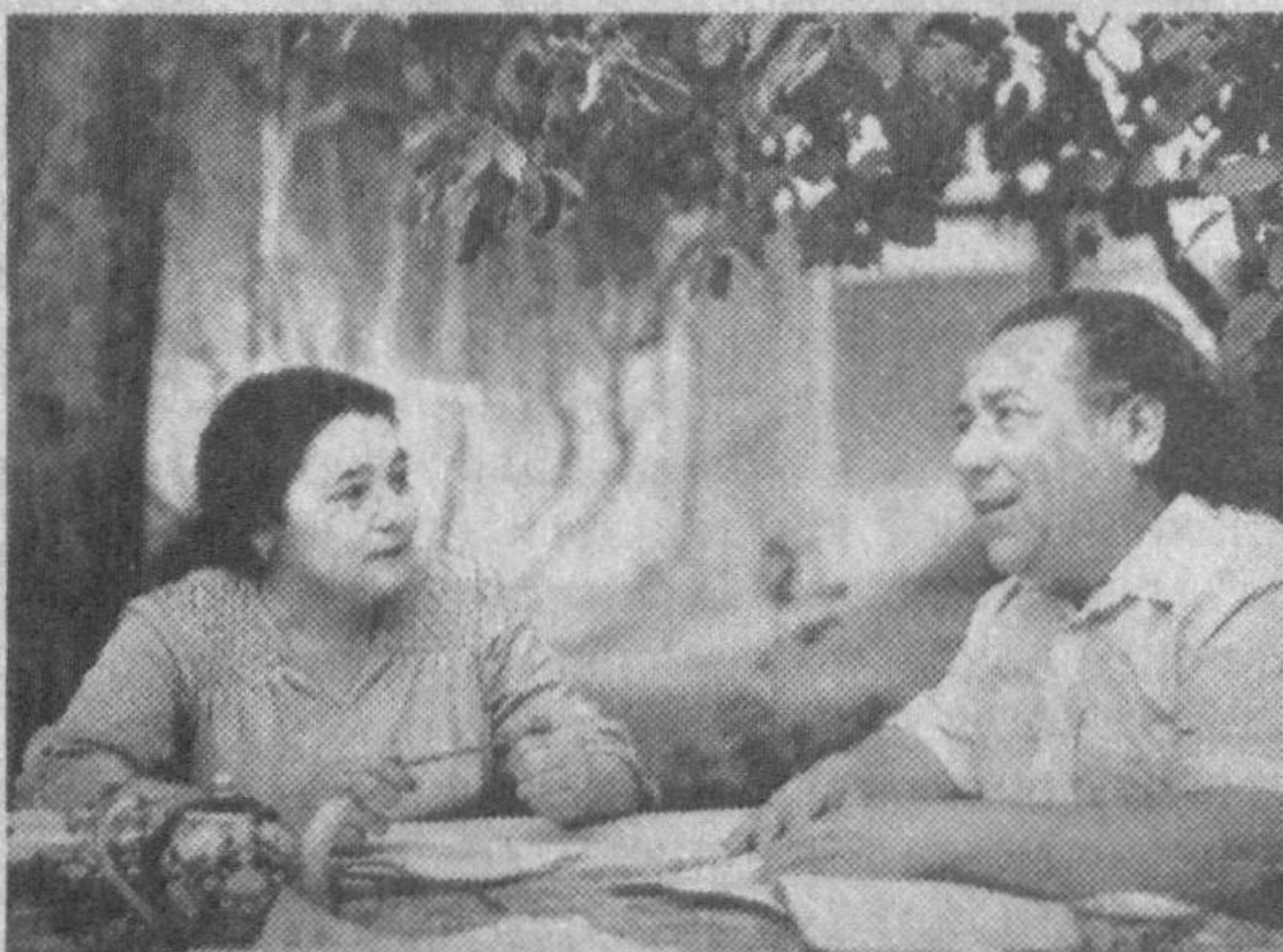
Бугун яна Зебосан, атлас қўйлак кийибсан, Бошинга оқ, нофармон пешонабанд илибсан.