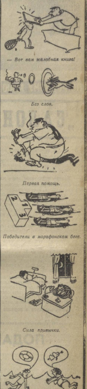
Вот вам жалобная книга! Без слов. Первая помощь. Победители в марафонском беге. Сила привычки. Без слов.