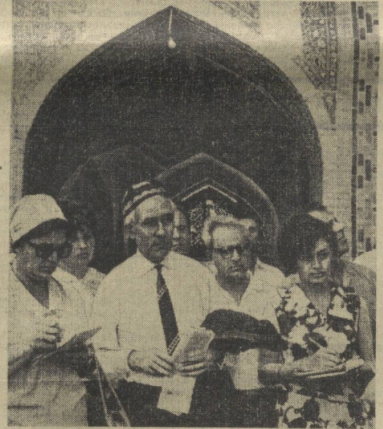
Участники декады в Самарканде знакомятся с памятниками старинными.

В. ПЕТРОВ. Соб. корр. «Правды Востока» по Кашкадарьинской области.