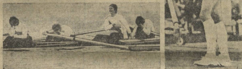
Спортсмены Мексики, Кубы, Сирии и СССР в Олимпийской деревне. На тренировке чехословацкие гандболисты. Сразу после финиша: спортсмены ГДР — чемпионы Олимпиады по академической гребле в четвeрке распашной с рулевой. Победительница Игр-80 по прыжкам в высоту Сара СИМЕОНИ (Италия).