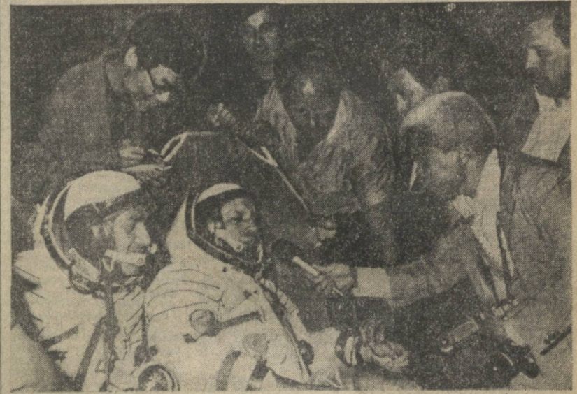
Космонавты В. Горбатко и Фам Туан (слева) после приземления.

Успешно завершённый космический полет убедительно свидетельствует о дальнейшем развитии научных и технических связей между Советским Союзом и социалистическими Вьетнамом, является новым ярким примером плодотворного сотрудничества ученых социалистических стран в мирном освоении и использовании космоса.