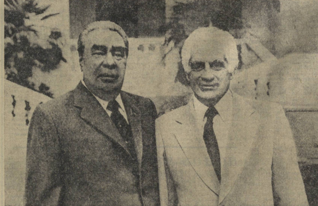
Встреча Л. И. Брежнев с А. Куньялом.